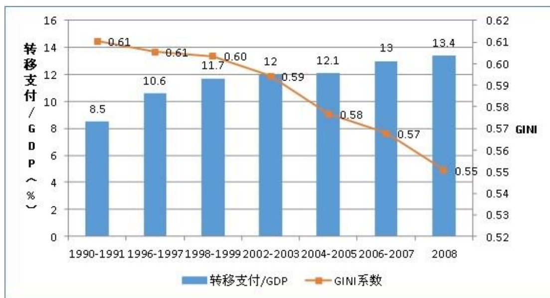
图 3: 巴西收入差距降低得益于转移支付的增加